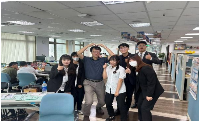
訪視時間：114.7.10 訪視機構：三商美邦人壽 1456 通訊處