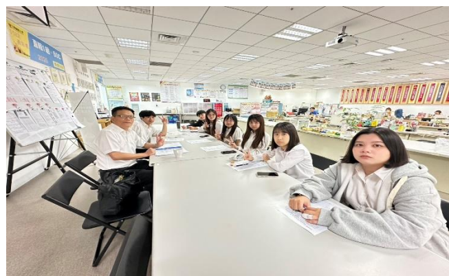
訪視時間：114.8.11 訪視機構：三商美邦人壽 1582 通訊處