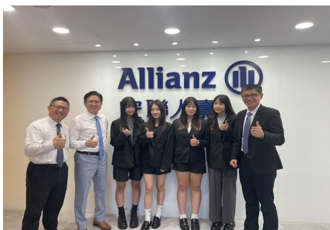
訪視時間：114.7.8 訪視機構：安聯人壽宏祥通訊處