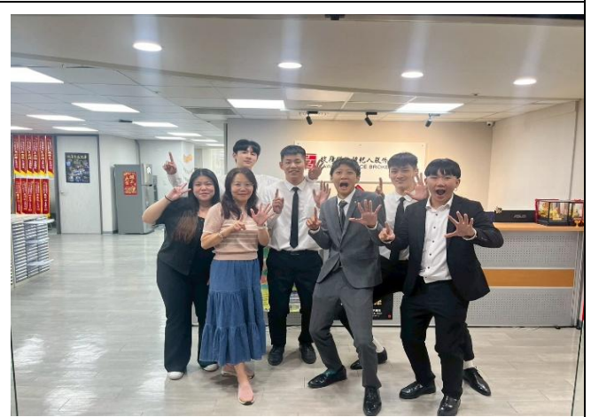
訪視時間：114.8.4 訪視機構：鉅偉保險經紀人中十五營業處