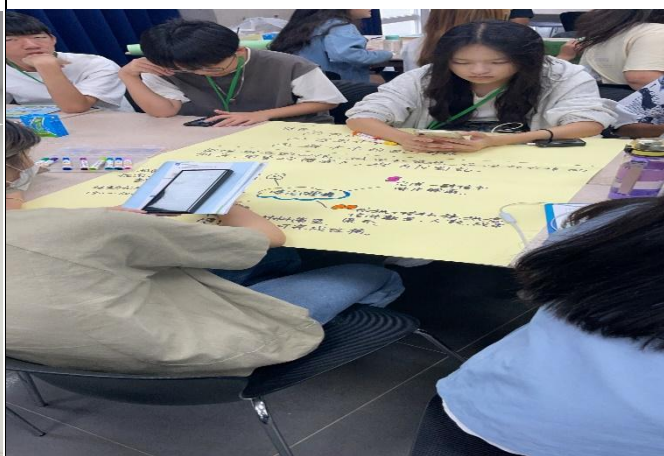
訪視時間：114.8.20 訪視機構：安聯人壽宏祥通訊處