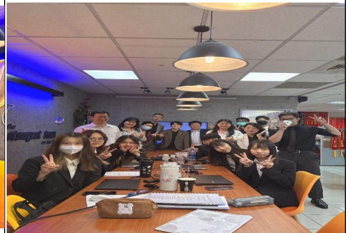
訪視時間：114.8.13 訪視機構：凱基人壽俞傑通訊處