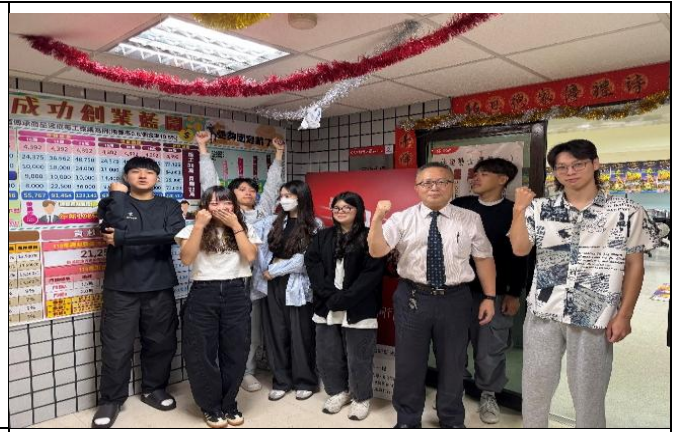
訪視時間：114.8.12 訪視機構：新光人壽中泰通訊處