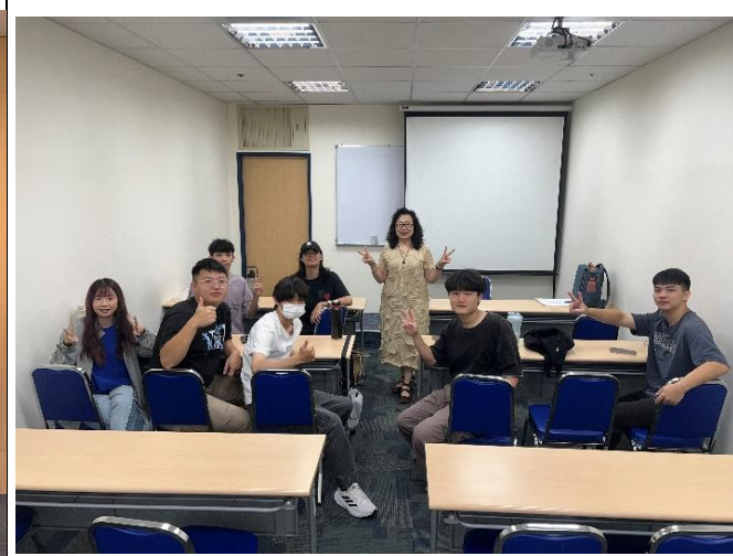
訪視時間：114.8.11 訪視機構：南山人壽大揚通訊處