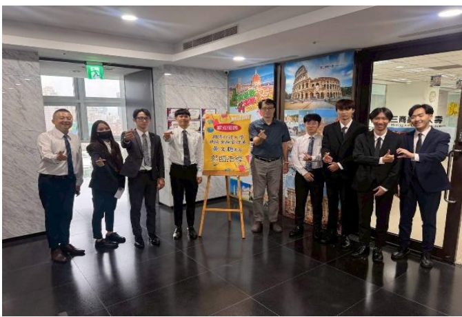
訪視時間：114.7.11 訪視機構：三商美邦人壽 1495 通訊處