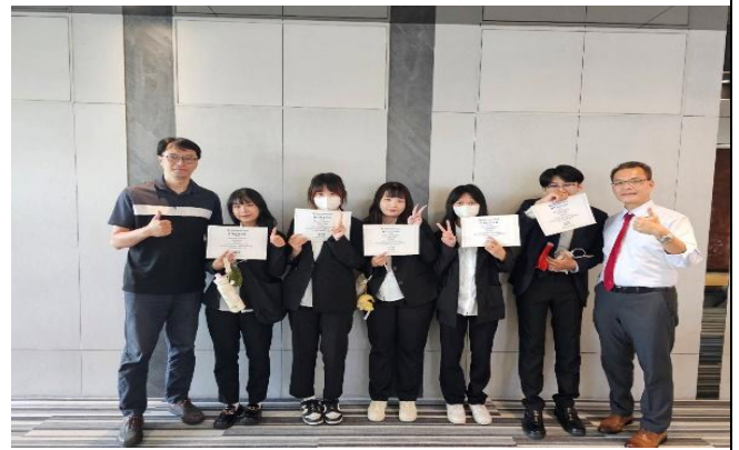
訪視時間：114.8.20 訪視機構：三商美邦人壽 1456 通訊處