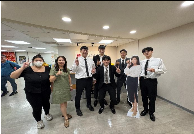
訪視時間：114.7.4 訪視機構：鉅偉保險經紀人中十五營業處