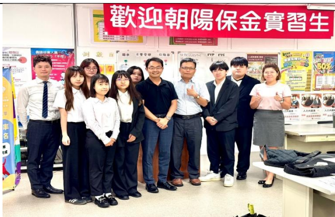
訪視時間：114.7.10 訪視機構：三商美邦人壽 1582 通訊處