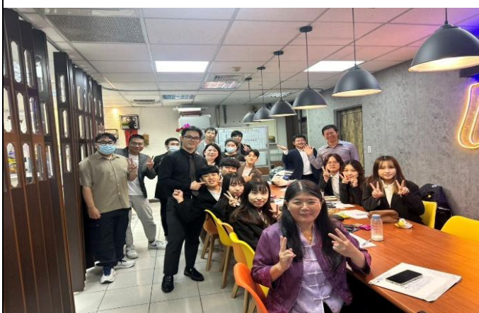
訪視時間：114.7.30 訪視機構：凱基人壽俞傑通訊處