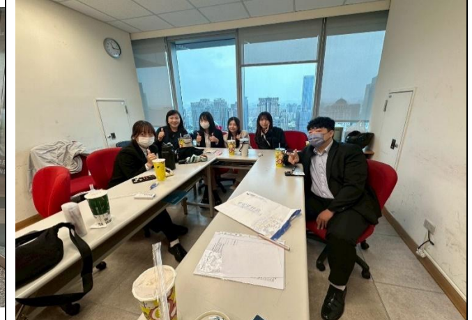
訪視時間：114.8.7 訪視機構：富邦人壽中怡通訊處