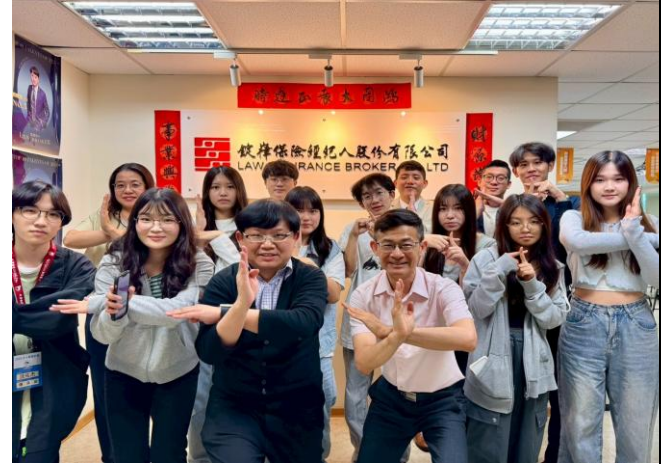
訪視時間：114.8.6 訪視機構：鉅偉保險經紀人中十營業處