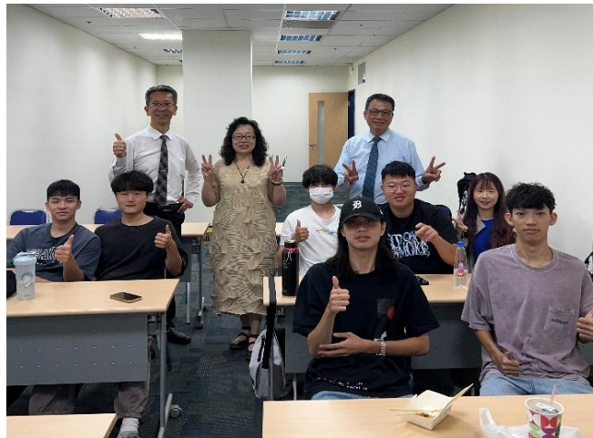
訪視時間：114.8.11 訪視機構：南山人壽文龍通訊處