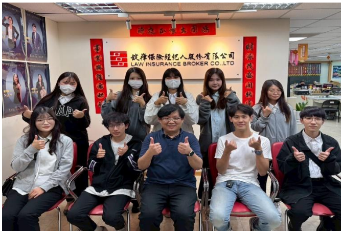
訪視時間：114.7.15 訪視機構：鉅偉保險經紀人中十營業處