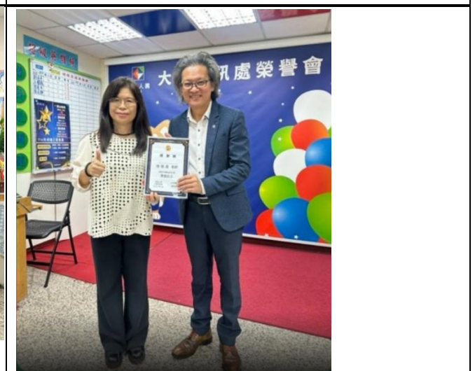
訪視時間：114.8.5 訪視機構：凱基人壽大華通訊處