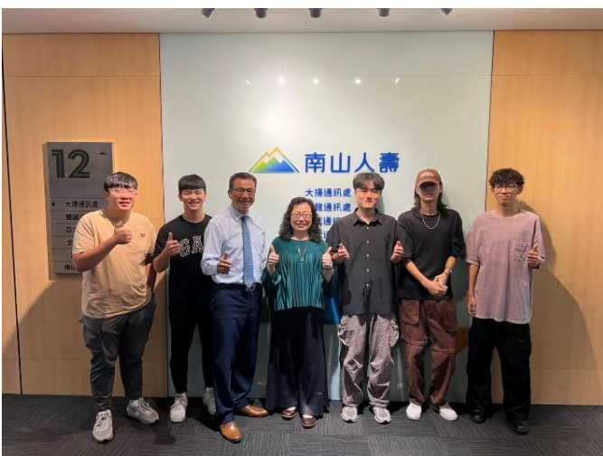
訪視時間：114.7.11 訪視機構：南山人壽大揚通訊處