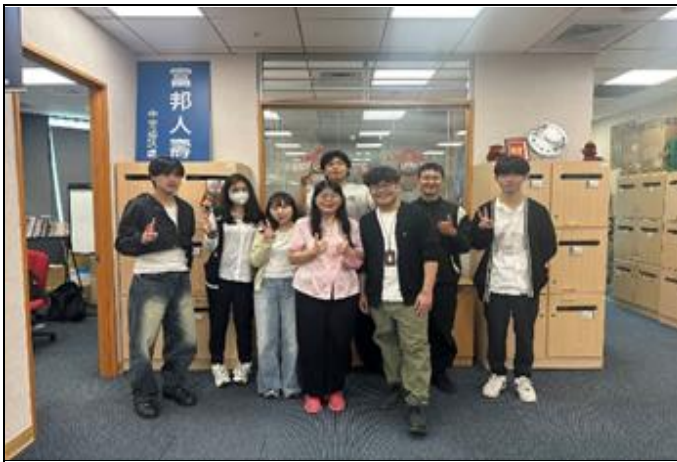
訪視時間：114.7.25 訪視機構：富邦人壽中樂通訊處