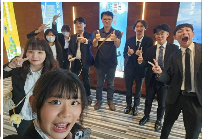
訪視時間：114.8.22 訪視機構：三商美邦人壽 1495 通訊處