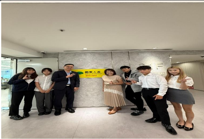
訪視時間：114.7.10 訪視機構：國泰人壽南屯通訊處