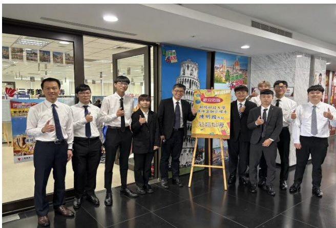
訪視時間：114.7.10 訪視機構：三商美邦人壽 1529 通訊處