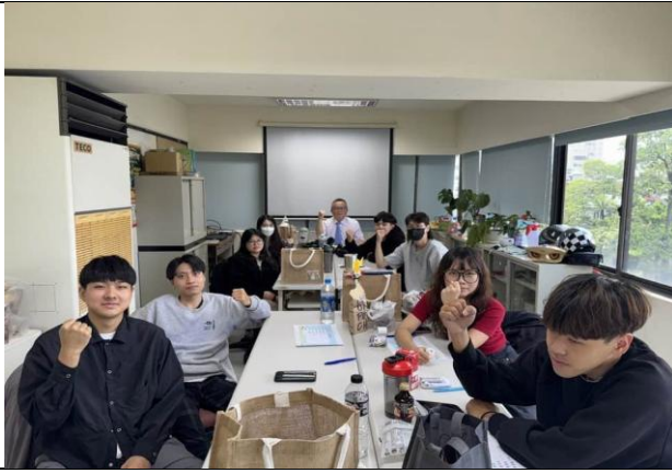
訪視時間：114.7.15 訪視機構：新光人壽中泰通訊處