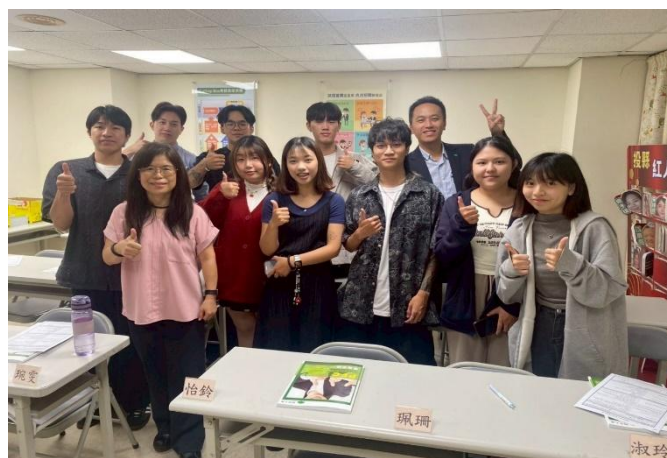
訪視時間：114.7.14 訪視機構：國泰人壽專招投縣通訊處