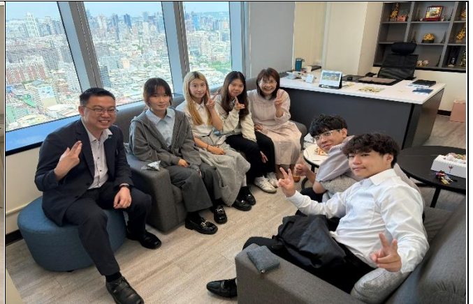
訪視時間：114.8.20 訪視機構：國泰人壽南屯通訊處