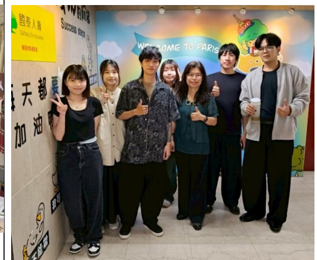
訪視時間：114.8.4 訪視機構：國泰人壽專招投縣通訊處