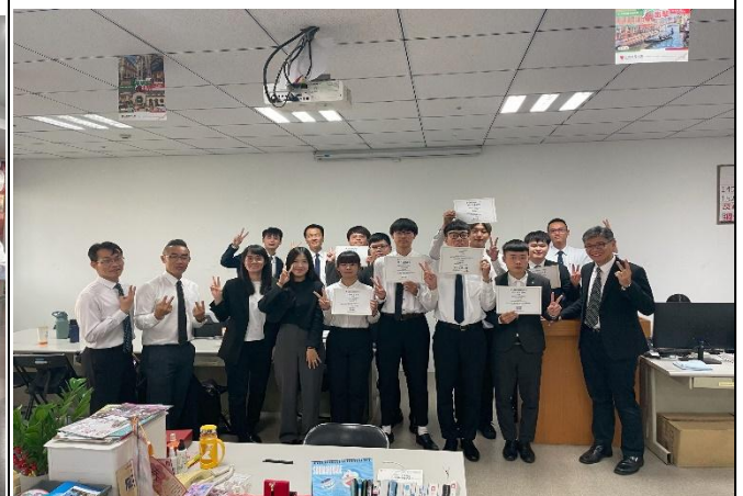
訪視時間：114.8.22 訪視機構：三商美邦人壽 1529 通訊處