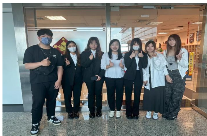
訪視時間：114.7.14 訪視機構：富邦人壽中怡通訊處