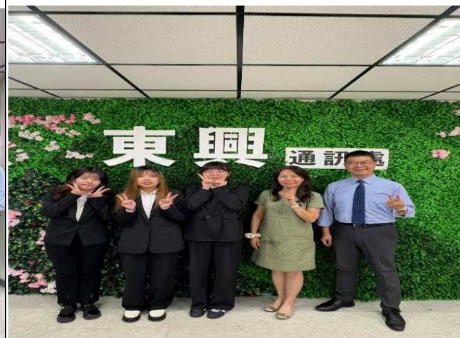
訪視時間：114.8.15 訪視機構：南山人壽東興通訊處