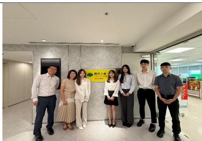
訪視時間：114.7.8 訪視機構：國泰人壽文心通訊處