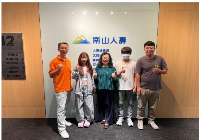
訪視時間：114.7.11 訪視機構：南山人壽文龍通訊處