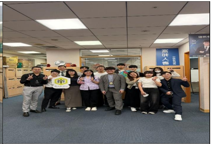
訪視時間：114.8.12 訪視機構：富邦人壽中樂通訊處