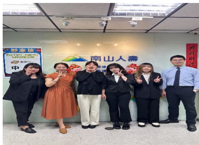
訪視時間：114.7.25 訪視機構：南山人壽東興通訊處